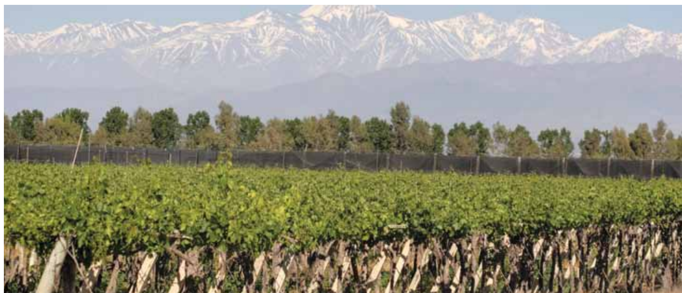
▲ Hermosa vista panorámica de las Fincas en Valle de Uco de Familia Zuccardi ubicadas en la colorida ciudad de Maipú, Mendoza.